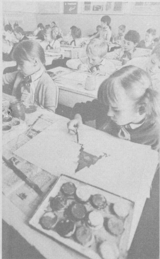
«Страна Великого Октября» — такова тема самостоятельных работ, которые выполнили на уроках рисования за день до каникул ученики таджикской школы № 37.