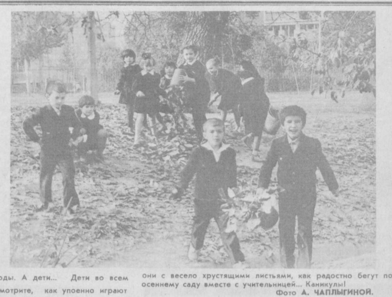
они с весело хрустящими листьями, как радостно бегут по осеннему саду вместе с учительницей... Канюки!