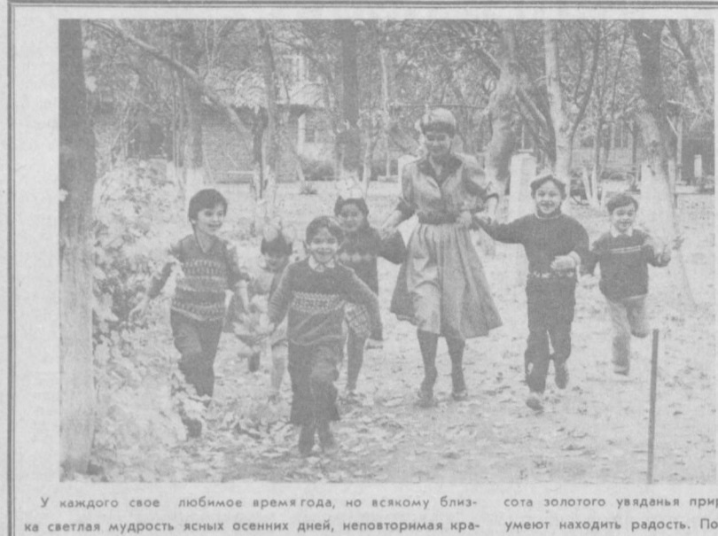
У каждого свое любимое время года, но всякому близка светлая мудрость ясных осенних дней, неповторимая красота золотого увядания природы. А дети... Дети во всем умеют находить радость. Посмотрите, как уверенно играют

Нет, не гостями приходят в детский сад будущие специалисты, а преимирами хорошего опыта работы. В этом большая заслуга педагогического коллектива, который помогает практикантам идти в ногу со временем.