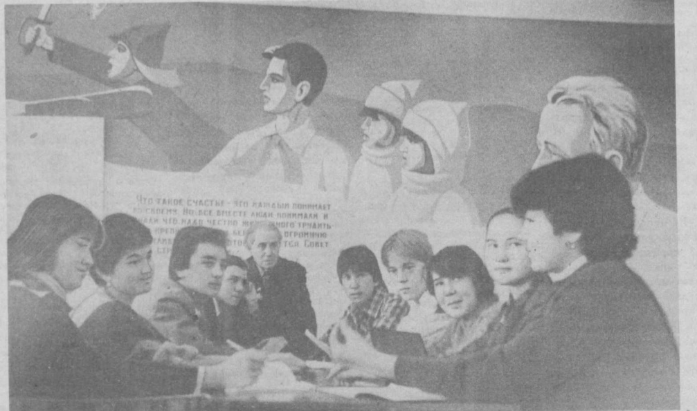
На снимках: в школе юных юристов идет очередное занятие.