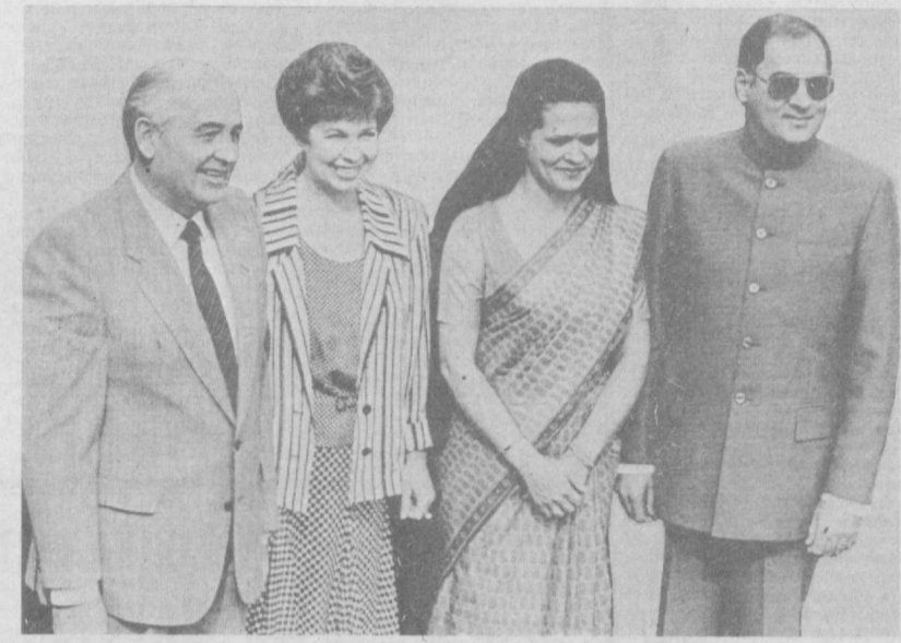
НА СНИМКЕ: во время встречи в аэропорту г. Дели.

На летном поле выстроен почетный караул трех видов вооруженных сил — пехотинцев, летчиков, моряков. У трапа самолета М. С. Горбачева и его супругу радостно встречали Премьер-министр Индии Раджив Ганди с супругой. Вместе с М. С. Горбачевым прибыл член Политбюро ЦК КПСС, министр иностранных дел СССР Э. А. Шеварднадзе, секретарь ЦК КПСС А. Ф. Добрынин, заместитель Председателя Совета Министров СССР В. М. Каменцев, помощник Генерального секретаря ЦК КПСС А. С. Черняев, начальник Генерального штаба Вооруженных Сил СССР — первый заместитель министра обороны СССР Маршал Советского Союза С. Ф. Ахромеев, первый заместитель министра иностранных дел СССР Ю. М. Воронцов. Над летным полем прокатывается эхо артиллерийского салюта — 21 залп. По древнему индийскому обычаю советскому руководителю преподносят гирлянд из живых цветов. Яркие букеты из рук детей — знак светлого и доброго гостеприимства. И, являясь дипломатом едва ли не по секундам, Михаил Сергеевич задерживается около индийских девочек. Одна из них обращается на русском языке: «Мы рады сердцем приветствовать Вас, Михаил Сергеевич! Очень приятно, что Вы пришли в Дели».