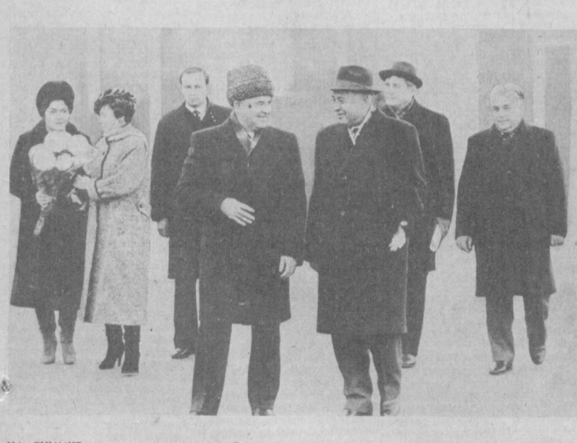
НА СНИМКЕ: во время проводов в Ташкентском аэропорту.