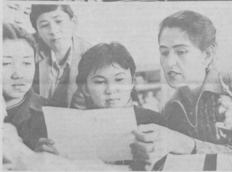
Когда на собраниях и педсоветах в ташкентской школе № 24 говорят на английском языке, имеют в виду не английский, а не немецкий, имеют в виду хинди — второй государственный язык Индии.