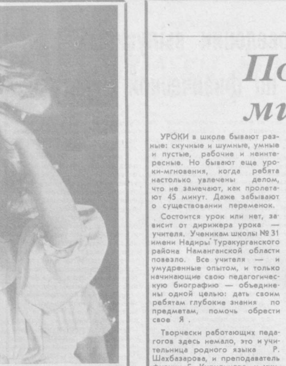
На снимках: жемчужина конкурса — «Жемчужина-89»; жюри почти единодушно; «работничек» моменты конкурса.

зации в деле укрепления здоровья народа, в развитии профилактических, физкультурных, лечебных учреждений. Участвует в осуществлении мероприятий по охране окружающей среды, соблюдению санитарно-гигиенических условий, улучшению условий труда и быта людей. Помогает государственным организациям в борьбе против алкоголизма, курения и других вредных привычек. Привлекает население к сознательному отношению к своему здоровью, занятиям физкультурой и спортом, потому что здоровье общества зависит от здоровья каждого его члена. Работает над повышением культуры медицинских работников. Принимают участие в осуществлении мероприятий, принятых союзными и международными организациями, по ликвидации последствий стихийных бедствий и эпидемий. Организовали республиканские отделения фонда «Милосердие» Минздрава УзССР, Узсоюзпроф, Общества Красного Полумесяца, Госкомитет по труду и социальным вопросам, Республиканский совет ветеранов войны и труда, Советский детский фонд имени В. И. Ленина, Госкомспорт, МВД, Миннобр, Узэгропром, Госкомпри-