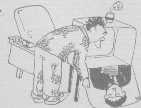
Непременно загляните. Рис. И. ЧУМАЧЕНКО.

Во 2-м номере недавно поступившего в Ташкент латвийского журнала «Родник» — рассказ Г. Газдалова «Счастие».