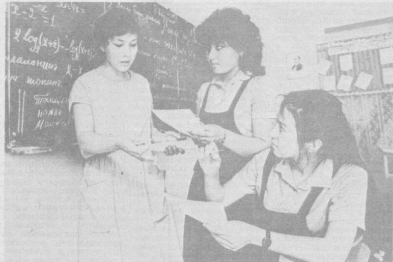
Беседавала М. ПАРЕНСКАЯ, наш корр.