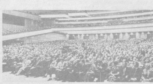
В зале во время заседания. Очередь к трибуне.

На утреннем заседании 30 мая, проходившем под председательством члена президиума депутата Р. Н. Нишанова, Съезд народных депутатов СССР перешел к рассмотрению вопроса об основных направлениях внутренней и внешней политики СССР. С докладом выступил Председатель Верховного Совета СССР М. С. Горбачев. Затем начались прения по обсуждаемому вопросу. Съезд народных депутатов СССР продолжает работу.