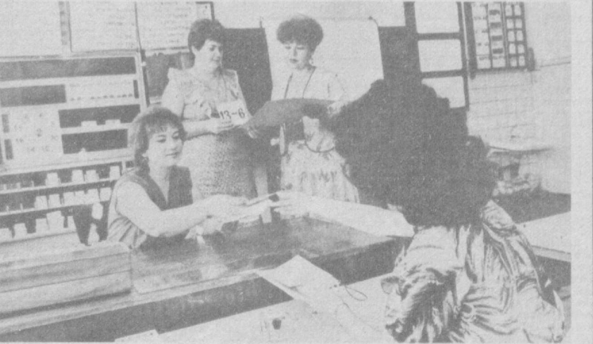
В ТАШКЕНТСКОМ институте усовершенствования учителей проходят курсы повышения квалификации педагогов начальных классов. На снимках: на одно практическое занятие не обходится без применения наглядных средств обучения; лекцию читает отличник