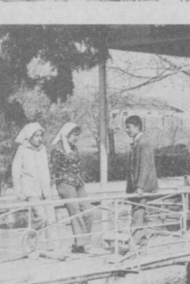
На снимках: члены звена цветоводов производят чеканку растений; приятно после работы на участке посидеть на полевом стане, тем более, что оборудован он прекрасно; бригадир цветоводческого звена —

ми, другим агротехническим приемам. Члены ученической бригады цветоводов никогда не сидят без дела. Завершив работы на своем участке, они занимаются чеканкой на соседних, нередко складывают цветы в букеты.