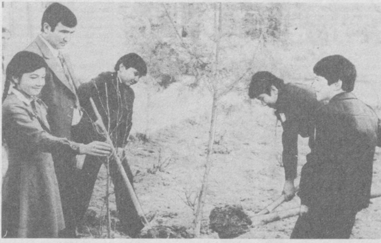
Вот так трудятся ученики школы № 9 Багшамальского района г. Самарканда на пришкольном участке.

Во встрече приняли участие заместитель министра просвещения УзССР Э. Г. Галикеев, председатель Республиканского комитета профсоюза работников просвещения, высшей школы и научных учреждений Э. К. Камиллова. Наш корр.