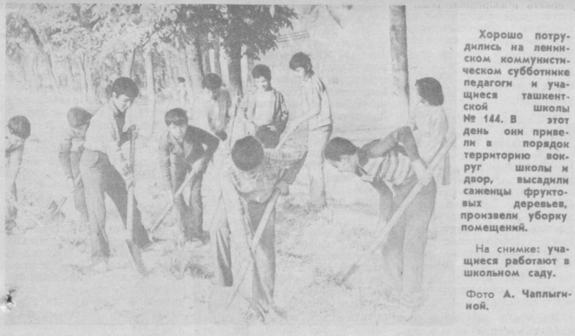
Хорошо потрудились на ленинском коммунистическом субботнике педагоги и учащиеся ташкентской школы № 144. В этот день они привели в порядок территорию вокруг школы и двор, высадили саженцы фруктовых деревьев, произвели уборку помещений. На снимке: учащиеся работают в школьном саду.

жи и комплектованию ПТУ учащимися, организации и совершенствованию учебно-воспитательного процесса в училище, обеспечению его инженерно-педагогическими кадрами, а также по организации быта и отдыха учащихся и работников среднего ПТУ. Базовое предприятие должно предусматривать в установленном порядке в планах экономического и социального развития и коллективных договоров меры по укреплению материально-технической базы, проведению ремонта зданий и оборудования среднего ПТУ, строительству спортивных и оздоровительных лагерей и лагерей труда и отдыха для учащихся, развитию у них интереса к техническому и художественному творчеству. Совет Министров СССР обязал министерства и ведомства СССР и Советов Министров союзных республик обеспечить активное участие базовых предприятий в повышении эффективности учебно-воспитательного процесса и качества подготовки квалифицированных рабочих кадров в средних ПТУ. (ТАСС.)