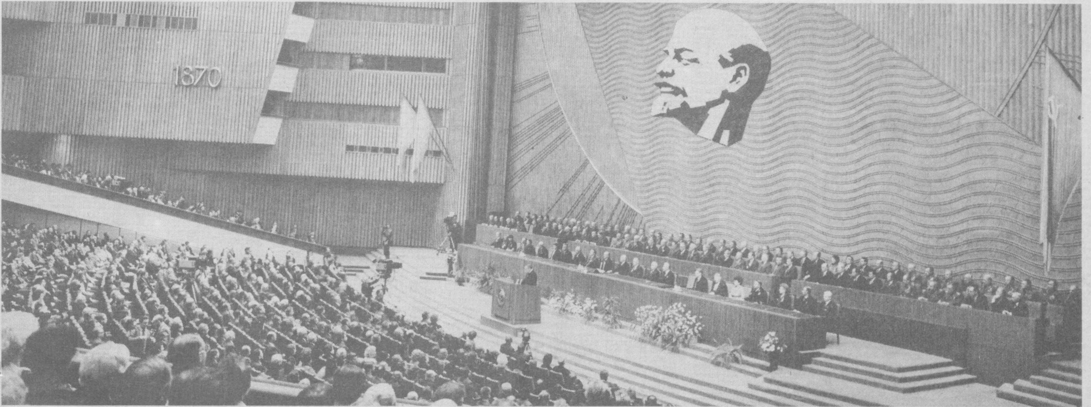
Торжественное заседание, посвященное 115-й годовщине со дня рождения В. И. Ленина.