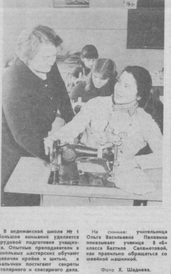
В андижанской школе № 1 большое внимание уделяется трудовой подготовке учащихся. Опытные преподаватели в школьных мастерских обучают девочек кройке и шитью, а мальчики постигают секреты столярного и слесарного дела.