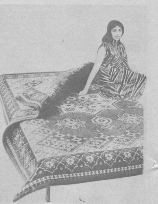
Узбекское рекламное агентство В/О «Союзторгреклама» (телефон 45-37-27).