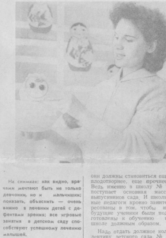
На снимках: как видно, зрителям мечтает быть не только девочками, но и мальчишками; показать, объяснить — очень важно в лечении детей с дефектами зрения; все игровые занятия в детском саду способствуют успешному лечению малышей.

И есть в этом детском саду то, что отличает его от двадцати четырех детских дошкольных учреждений г. Гулистана. Это специализированная группа для детей с дефектами зрения. А поскольку воспитываются в ней малыши из самых разных районов Сырдарьинской области, то и функционирует она круглогодично. Но об этом чуть позже.