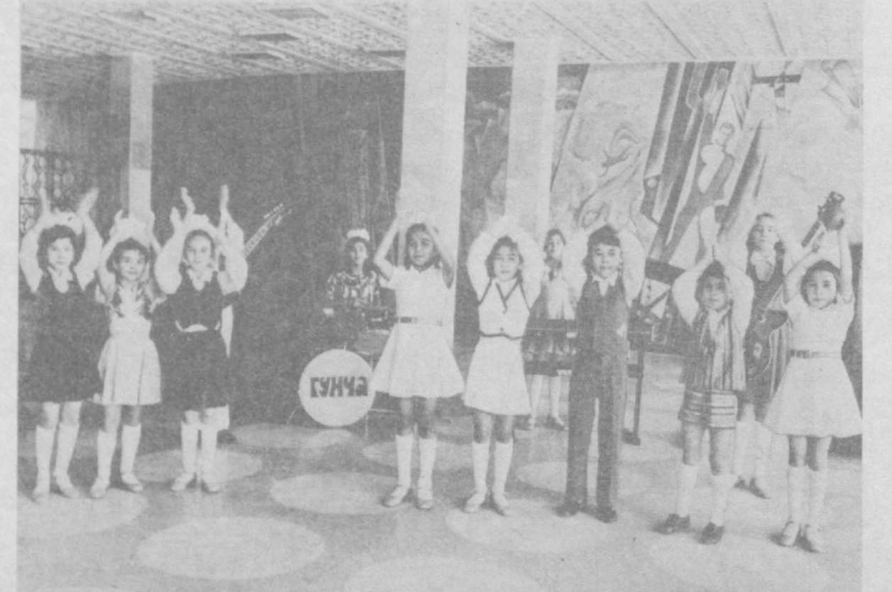
Большую концертную программу готовят в Московском молодежном фестивале лучшие музыкальные коллективы страны. Среди тех, кто будет представлять искусство Узбекистана, — детский хореографический ансамбль «Булбульча» Хазараспского дома пионеров Хорезмской области и вокально-инструментальный ансамбль «Гунча» Республиканского дворца пионеров и школьников им. В. И. Ленина.