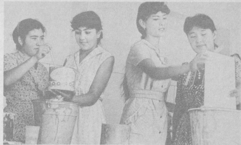
Завершается ремонт в школе № 3 Газалкента. Выпускники решили своими силами произвести ремонт кабинетов. На снимке: десятиклассники готовят материалы для покраски.