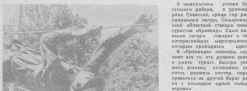
В живописном уголке Ургучского района, в урочище реки Севасай, среди гор расположился лагерь Самаркандской областной станции юных туристов «Краевед». Само название лагеря говорит о тех интереснейших мероприятиях, которые проводятся здесь.