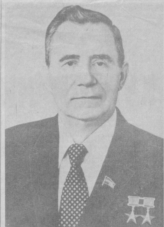
Андрей Андреевич Громыко — Председатель Президиума Верховного Совета Союза Советских Социалистических Республик

ПОСТАНОВЛЕНИЕ ВЕРХОВНОГО СОВЕТА СССР Об избрании депутата Громыко А. А. Председателем Президиума Верховного Совета СССР Верховный Совет Союза Советских Социалистических Республик постановляет: Избрать депутата Громыко Андрея Андреевича Председателем Президиума Верховного Совета СССР. Первый заместитель Председателя Президиума Верховного Совета СССР В. КУЗНЕЦОВ, Секретарь Президиума Верховного Совета СССР Т. МЕНТЕШАШВИЛИ. Москва, Кремль, 2 июля 1985 г.