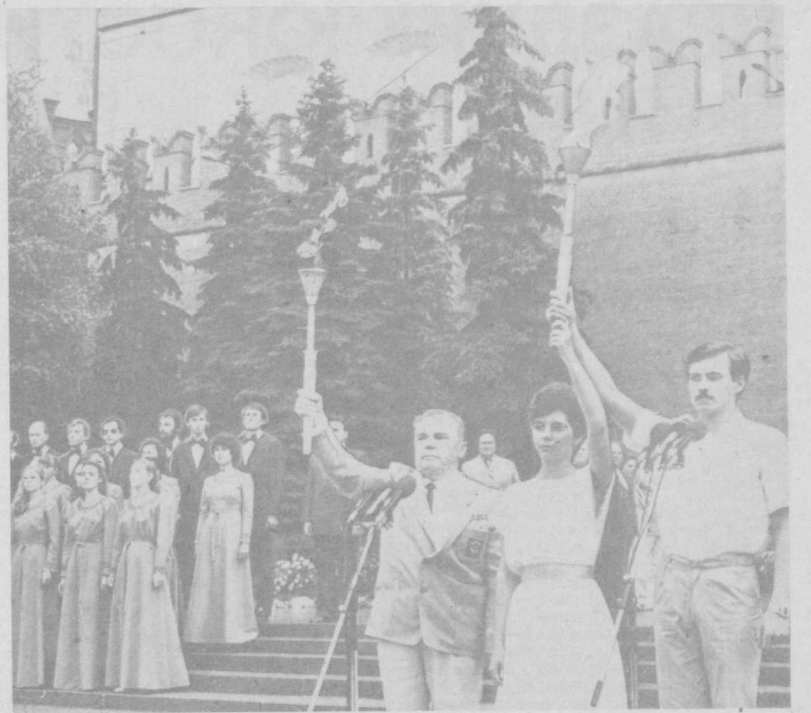
НА СНИМКЕ: во время церемонии зажжения фестивального огня.

ЦК Компартии Узбекистана выражает твердую уверенность в том, что партийные комитеты, советские, профсоюзные и комсомольские организации, работники культуры и спорта, все трудящиеся республики оделяют все для того, чтобы наша жизнь стала еще ярче, духовно богаче, проявляя еще больше инициативы и упорства, организованности и дисциплины, с честью, достойно встретив XXVII съезд КПСС и XXI съезд Компартии Узбекистана.