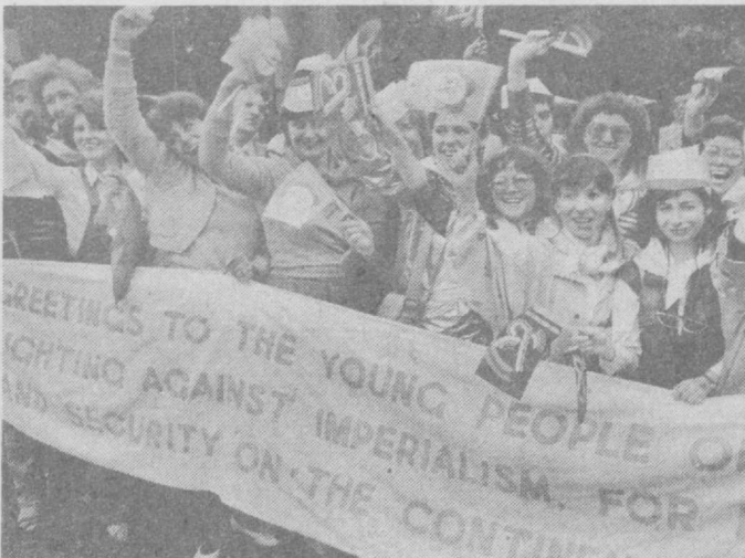
Москва, 27 июля 1985 года. Торжественное шествие делегатов XII Всемирного фестиваля молодежи и студентов.