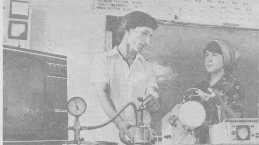
В школе № 13 Хавастского района Сырдарьинской области почти все готово к началу нового учебного года. Послед-