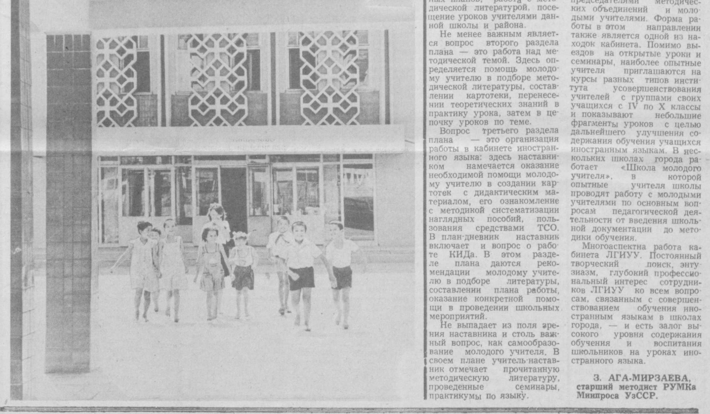
На снимке: фасад школы № 127.

М. ЛЫСЕНКО, зав. кабинетом русского языка и литературы Самаркандского облИУУ