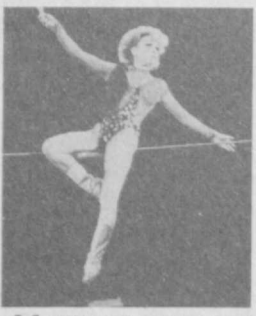
В Ташкентском государственном цирке проходят большие представления с участием мастеров цирковых коллективов.