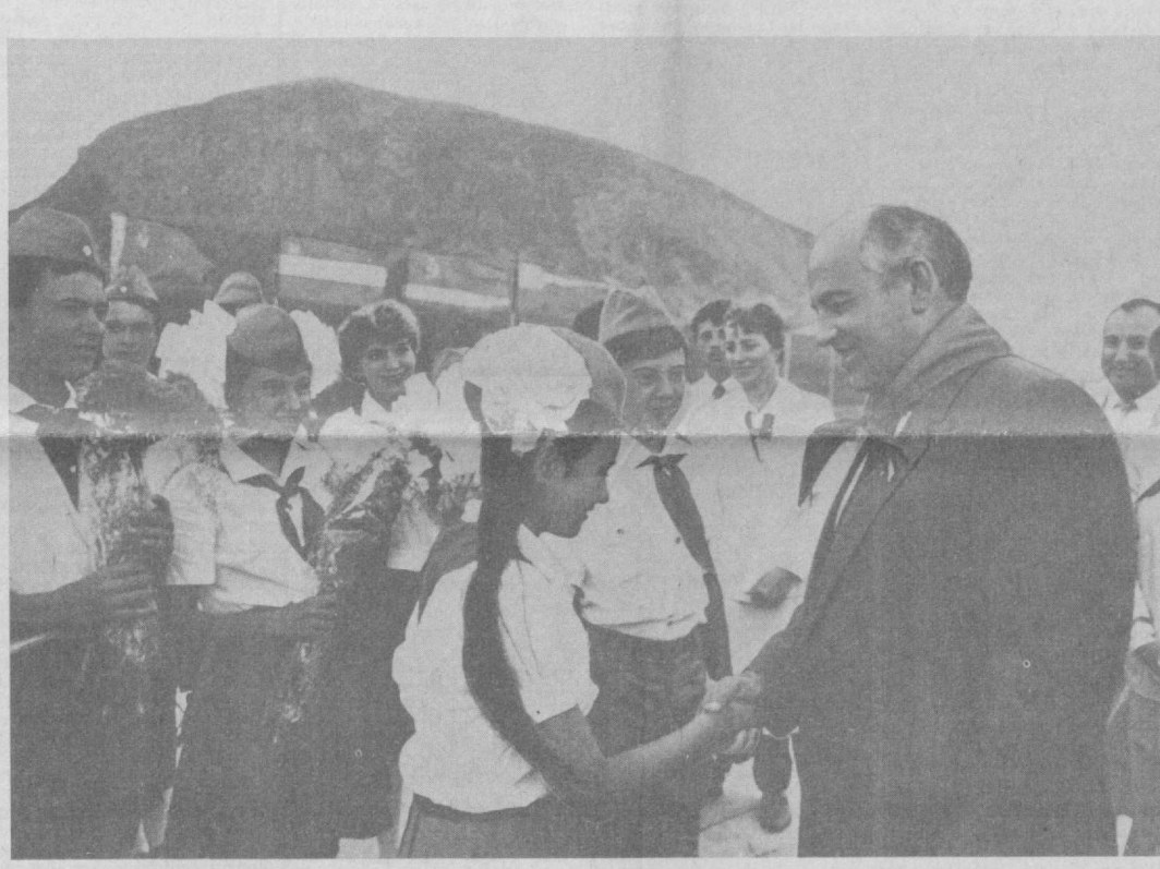
НА СНИМКЕ: М. С. Горбачев среди артековцев.

М. С. Горбачев спрашивал ребят об их успехах в учебе, интересах, пожелал им хорошего отдыха.