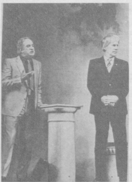
С успехом проходит в Ташкенте гастроль Ленинградского академического театра комедии. В его репертуаре пьесы известных советских авторов.