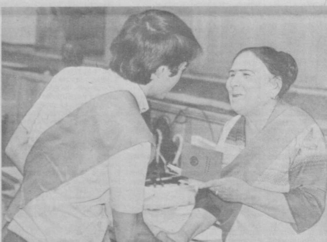
В Сабир Разимовском районе состоялась встреча ветеранов-педагогов с молодыми специалистами.