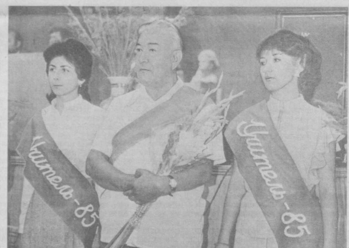
На снимке: вручение трудовых книжек.