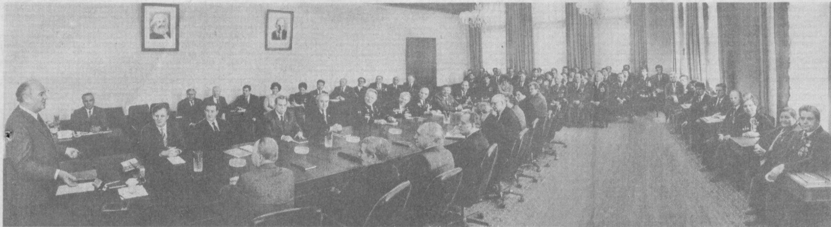
Во время встречи.

Встреча в ЦК КПСС с ветеранами стахановского движения, передовиками и новаторами производства