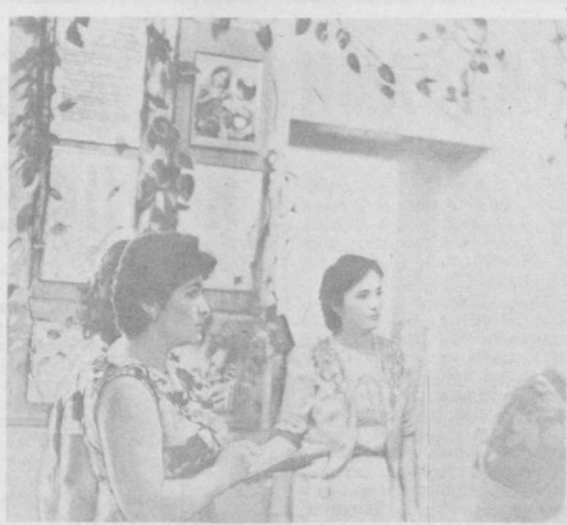
Внешний вид помещения. Как важен он для его обитателей. Особенно если это — дети. С большим вкусом оформлен интерьер групповых комнат детского сада № 475 города Ташкента. Здесь уделяют много внимания развитию эстетического вкуса ребят, их творческой активности. На снимках: воспитатели детских садов города знакомят с оформлением групповых комнат; выставка поделок из природного материала, подготовленная воспитанниками детского сада № 475.