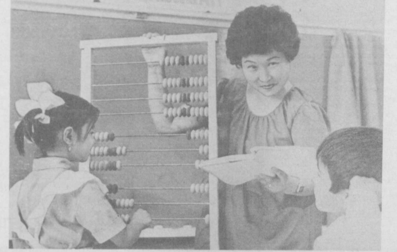
Не будет сложностей с выполнением домашнего задания у мальчишек и девчонок 3 «Б» класса школы № 15 Акмальского района Сырдарьинской области. Группу продолжает школьный методобъединения, работы по самообразованию учителя.