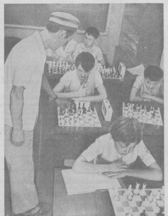
В Сабир Рахимовском районе Ташкента, при жэке № 23 работает подростковый клуб «Факел». Здесь в различных кружках и секциях занимаются десятки ребят. Одной из популярных является секция шахмат, где под руководством опытных тренеров ребята изучают основы этой увлекательной игры.

Материалы 3-й страницы подготовил М. КИРПИЧЕНКО, наш корр.