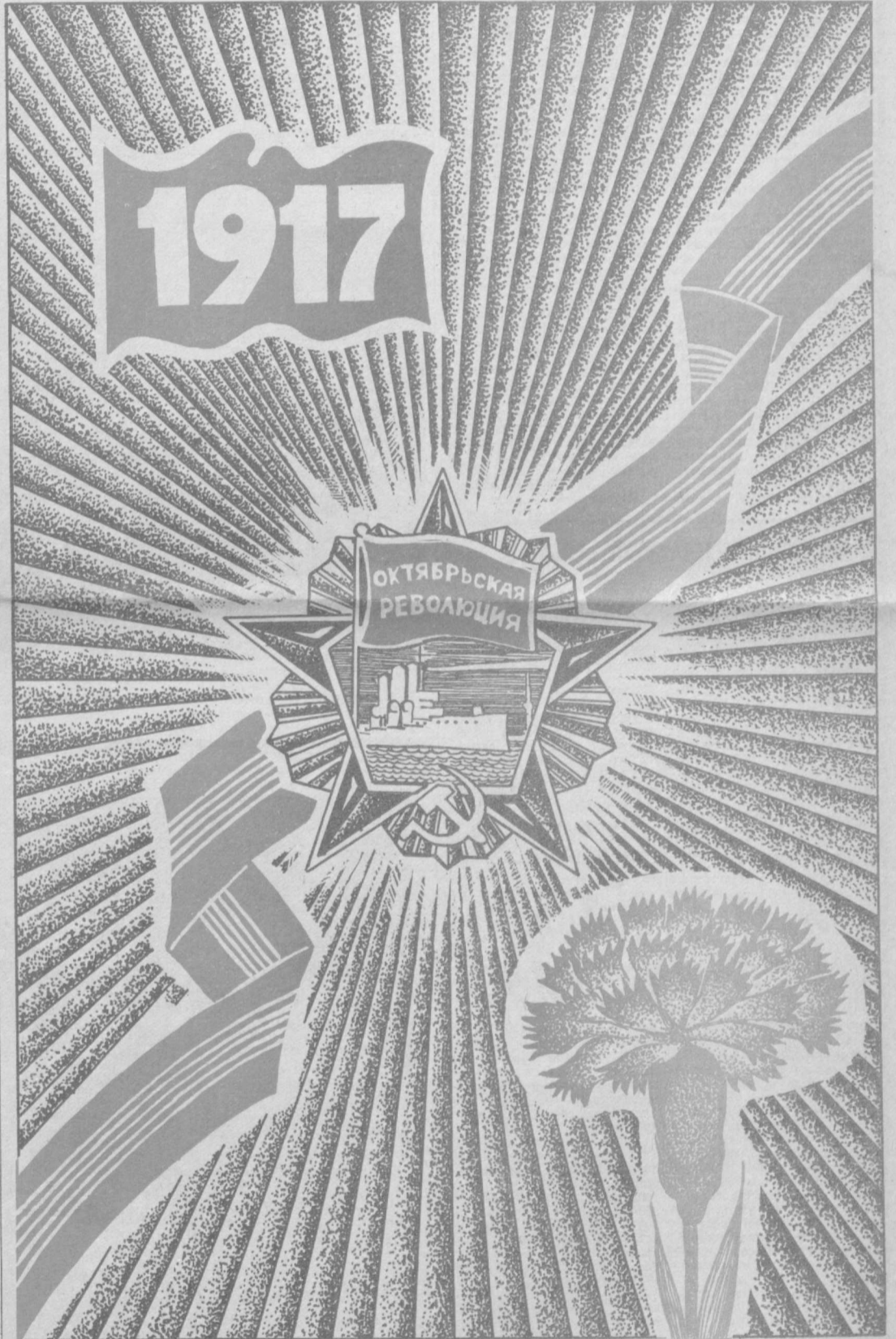
Плакаты художника М. АГЛЯМОВА.

Вот и нынешней осенью в горячую пору уборочной страды питомцы училища помогают собирать урожай труженикам ордена Трудово-