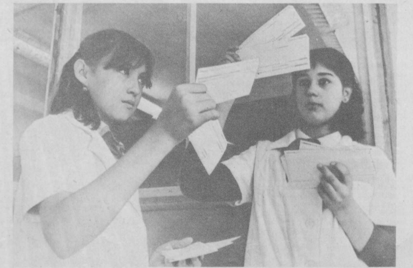
На снимках: теоретическое занятие в машинном зале; работа с перфокартами.