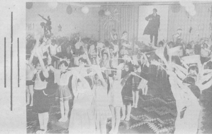
В трудовых, студенческих, ученических коллективах, во всех городах и кишлаках нашей республики прошли яркие праздники, посвященные Октябрю. Даже малыши принимали участие в специально организованных утренниках.