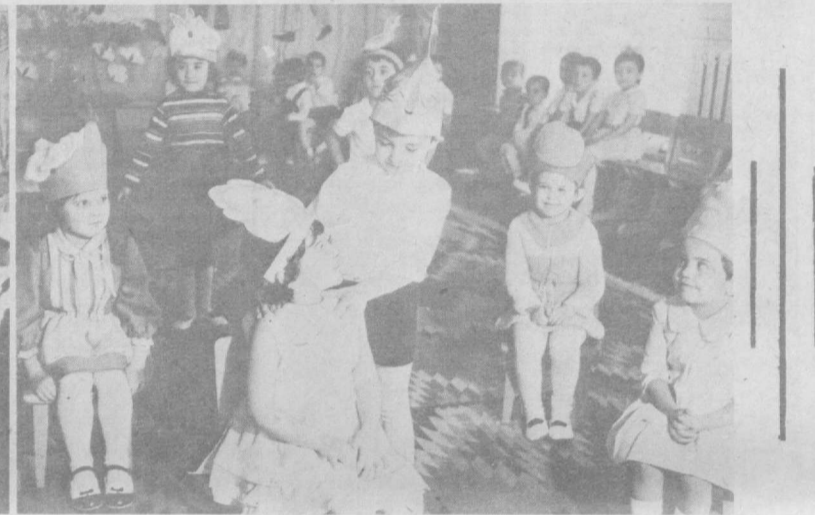
Эпизод одного из таких детских праздников запечатлел наш фотокорреспондент в детском саду № 227 Октябрьского района Ташкента.