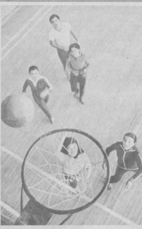
Бросок.