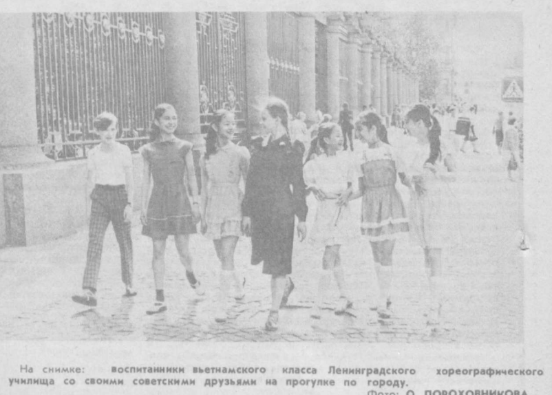
На снимке: воспитанники вьетнамского класса Ленинградского хореографического училища со своими советскими друзьями на прогулке по городу.

Э. ТУХВАТУЛЛИНА, корр. УзТАГ, Самарканд.