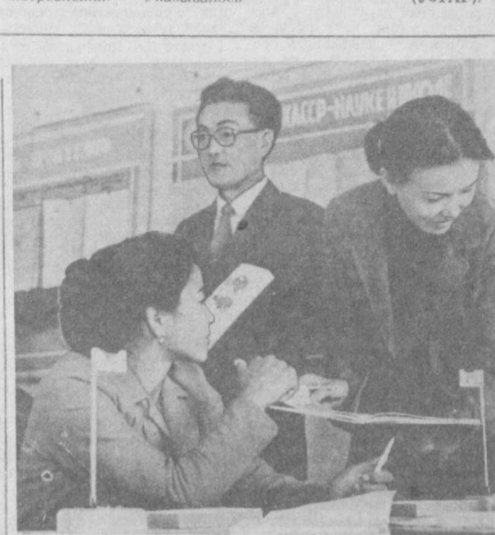
У слушателей группы русского языка в национальных классах областного института усовершенствования учителей ККАССР горячая пора. Завершается первое полугодие учебного года, намечаются планы на второе.

При посещении предприятий подчеркивалась важность приведения в действие всех резервов роста производительности труда, сокращения потерь рабочего времени, наращивания выпуска новых машин, увеличения производства товаров народного потребления. Указывалось на необходимость развития социальной структуры города, расширения жилищного строительства.