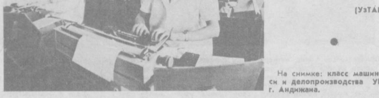
На снимке: класс машинописи и делопроизводства УПК-1 г. Андриана.