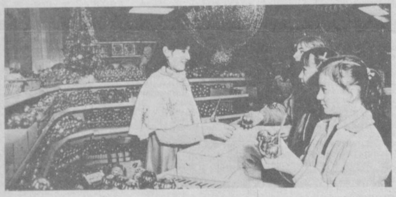
Яркими предновогодними красками расцвечены города и села нашей республики. Повсеместно раскинулись новогодние базары, украшены нарядами