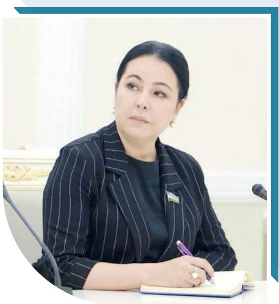
Мавлуда ИБРАГИМОВА, Олий Мажлис Қонунчилик палатаси депутаты, О‘zLiDeP фракцияси аъзоси

Хулоса ўрнида айтадиган бўлсак, Ўзбекистонда ёшлар сиёсати изчил ва стратегик характер касб этиб, ёш авлоднинг мамлакатнинг илмий, иқтисодий ва маънавий юксалишида бош омилга айлантирмоқда. Буларнинг замирида давлат раҳбарининг узоқни сўзлаган сиёсати ва юрт тақдирига дахлдорлик туйғуси ётади.