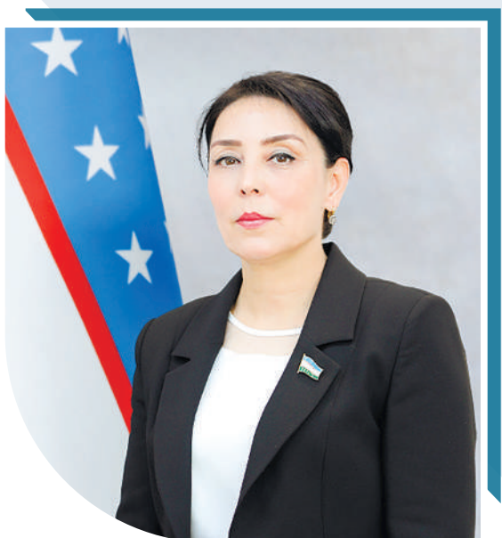
Барно БЕРДИЕВА, Олий Мажлис Қонунчилик палатаси депутаты, О‘zLiDeP фракцияси аъзоси

Чуқур билим ва маънавий баркамоллик устун жойда ҳамisha тараққиёт бўлади. Ваҳоланки, қиз бола қанчалик илмли ва шижоатли бўлса, буни келгусида фарзандларига ҳам оқтиради, ҳар томонлама баркамол ёшларни