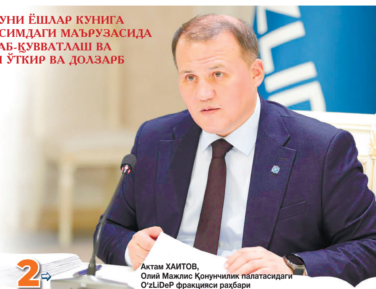
Ақтам ХАИТОВ, Олий Мажлис Қонунчилик палатасидаги О'zLiDeP фракцияси раҳбари

Мамлакатимизда ёшларга нафақат эртанги ўзгаришларга сабаб бўладиган муҳим куч, балки жамият тараққийотининг мустаҳкам таянчи сифатида қаралади. Ёшлар том маънода, Ўзбекистоннинг энг катта бойлиги, ёруғ келажакимиз бунёдкоридир. Ёшларга доир давлат сиёсати асосида ёш авлоднинг ҳаётий манфаатларини таъминлаш, уларнинг эзгу орзу-интилишлари, қобилият ва истеъдодини рўёбга чиқаришга қаратилган ташкилий-ҳуқуқий асослар такомиллаштирилиб борилмоқда. Айниқса, янги тахрирда қабул қилинган "Ёшларга оид давлат сиёсати тўғрисида"ги қонун йигит-қизларнинг ҳуқуқ ва эркинликларини таъминлашда мустаҳкам ҳуқуқий асос бўлиб хизмат қилаётир. Янги тахрирдаги Конституцияда ҳам давлат ёшларнинг интеллектуал, ижодий, жисмоний ва ахлоқий жиҳатдан шаклланиши ҳамда ривожланиши, уларнинг таълим олиш, соғлиғини сақлаш, уй-жойли бўлиш, ишга жойлашиш ва дам олиш ҳуқуқларини таъминлаш мақсадида етарли шароит яратиш учун қайғуриши белгилаб қўйилди.