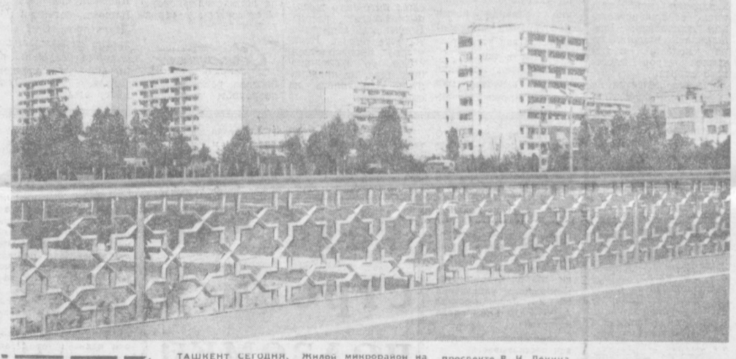
Жилон мирорайон на проспекте В. И. Ленина.