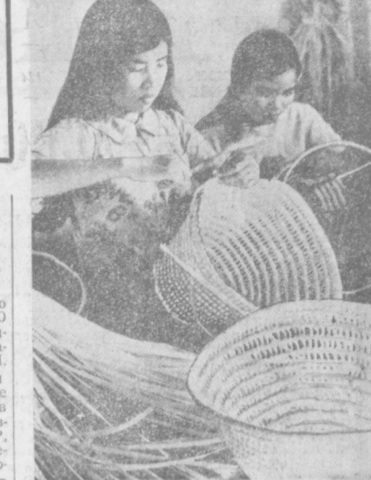
В Южном Вьетнаме создаются новые предприятия местной и кустарной промышленности. НА СНИМКЕ: плетение корзин в одной из новых артелей в городе Хошимин.