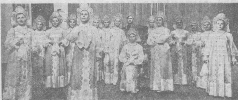
УКРАИНСКАЯ ССР. С большим успехом проходит выступления женского вокального ансамбля «Яблонья». Запорозского дворца культуры «Орбита». В его репертуаре песни народов СССР. Самодельных артистов тепло принимали в Киеве и Полтаве, Кременчуге и Виннице, Кировограде и Ирпине Рогов, других городах республики. НА СНИМКЕ: выступает женский вокальный ансамбль «Яблонья».