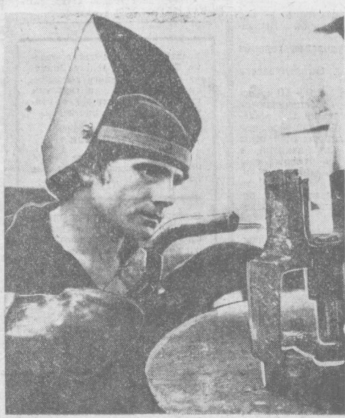
Городское профессионально-техническое училище № 14 готовит ткачей, слесарей, газомехаников, механиков счетно-вычислительных машин. В нынешнем году его заканчивают 286 юношей и девушек, которые будут трудиться на заводах «Ташсельмаш», опытно-механическом имени Ильича, вычислительных центрах предприятий и институтов. Впервые училище подготовило 106 специалистов, которые получат диплом о профессии и среднем образовании.