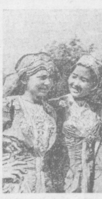
Коллектив художественной самодеятельности Дома культуры имени Хамиды Алимджана один из лучших в Кировском районе. Особой популярностью у жителей района пользуется танцевальный коллектив.

В ночь лучшего затмения и происходит драматическое событие, погибает комсомолец Нигмат. Служба закончена, рисует автор обстановку в кишлаке, хитрых, коварных врагов. Их жгучая ненависть к новой власти с трудом сдерживается до поджогового часа, прикрывает с ласковой улыбочкой, рассуждениями о чести мусульман, об уважении к старым зако-