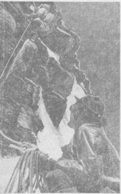
Имена узбекских альпинистов В. Эльчибекова, А. Путинцева, Л. Буршевой, В. Ворониной, А. Лбины и многих других известны в нашей стране. Они не раз завоевывали дипломы и золотые медали чемпионов СССР по альпинизму. Отважные спортсмены победили коварные снега пика Победы и Ленина, суровые метели Хан-Тенгри, отвоевали и покорили мир «семитысячников». НА СНИМКЕ: трудовой участок.

Развалины крупнейшего древнего города обнаружили археологи на территории республиканского клад, насчитывающий около пяти тысяч медно-свинцовых монет местной чеканки. Ведутся раскопки древнего города Чуйской долины. По мнению специалистов, здесь в средние века находился Баласагун — крупный культурный и политический центр Востока. Историческую ценность представляет главнейшая достопримечательность его — башня бурана. (ТАСС). Фрунзе.