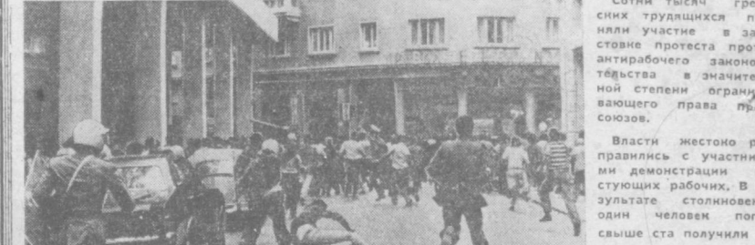
Сотни тысяч греческих трудящихся приняли участие в забастовке протеста против антирабочего законодательства в значительной степени ограничивающего права профсоюзов. Власть жестоко репрессировала участников демонстрации базирующихся рабочих. В результате столкновения один человек погиб, свыше ста получили тяжелые ранения, около 150 арестованы. НА СНИМКЕ: полицейская расправа с участниками демонстрации в Афинах.