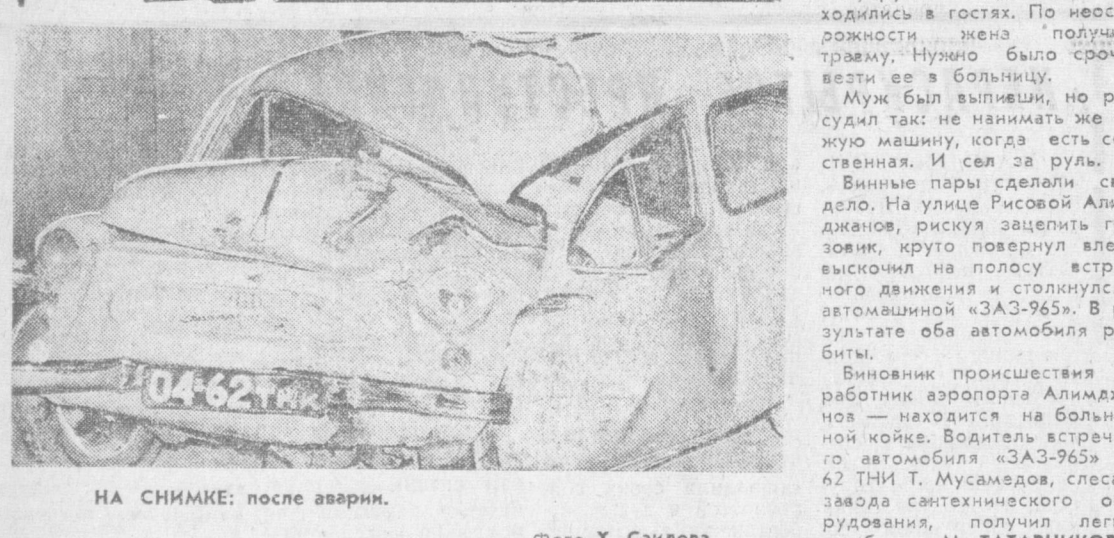
НА СНИМКЕ: после аварии.