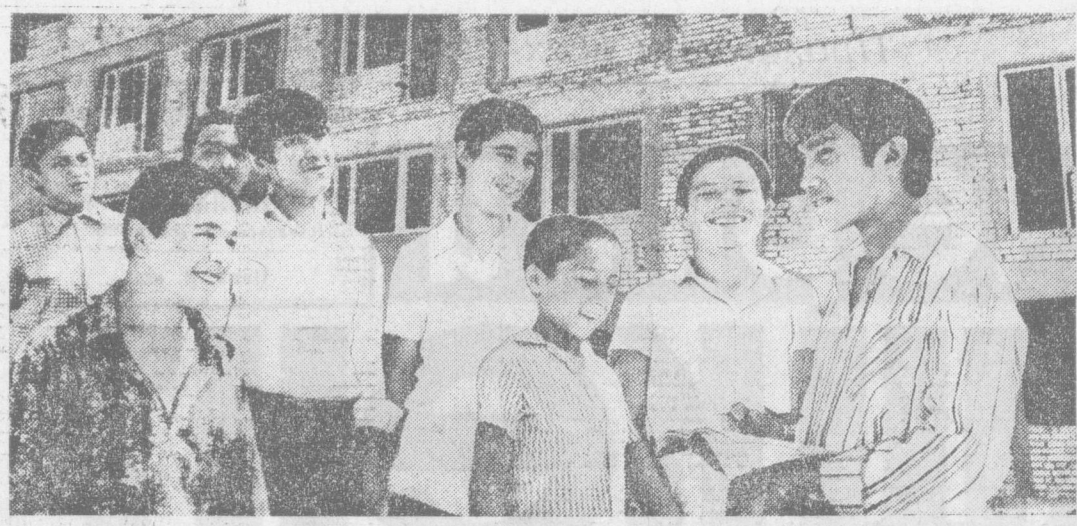
ГПУ-22 готовят рабочую смену для Главаштестрой: плотники, столяры, маляры, штукатуры, мозаичники, плиточники-облицовщики, паркетники. Познать секреты избранной специальности ребята помогают конкурсы на лучшее по профессии, кружки технического творчества. НА СНИМКЕ: для этих работ наступила последняя производственная смена. Она проходит на строительстве корпусов ТашМИ. Пройдет совсем немного времени, и они станут полными членами строительных бригад, возглавляющих эти Ташинта.

совхозстрой», которые в 10-й пятилетке приступили к осуществлению программы водохозяйственных мероприятий, обеспечивающих ввод 170 тысяч гектаров новых земель в Голандию, Джаназинскую и Кашкардинскую степей с одновременным строительством административных и жилых зданий. Многочисленные фотографии рассказывают об успехах коллектива научно-исследовательского института ветеринарии, который выпустил за минувшую пятилетку 7 тысяч литров новой вакцины против козакариоза, что позволило сохранить около 3 миллионов голов овец и коз.