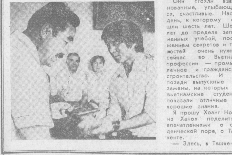
Они стояли взволнованные, улыбающиеся, счастливые. Настал день, к которому они шли шесть лет. Шесть лет до предела заполненных учебных, постижением секретов и тонкостей очень нужной сейчас во Вьетнаме профессии — промышленного и гражданского строительства. И вот позади выпускные экзамены, на которых все вьетнамские студенты показали отличные и хорошие знания.

Среди награжденных и ряд учреждений города Ташкента: дворцы культуры тракторного завода и ДСК № 1, клубы «Заря Востока» авиационного производственного объединения имени В. П. Чкалова и ЦММ, Дом культуры завода «Ташкенткабель», красные уголки №№ 24, 26 и 97 авиационного производственного объединения имени В. П. Чкалова и Октябрьского треста столовых.