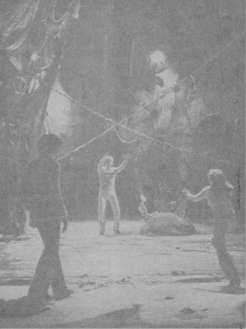
считались с этими рекомендациями.

Наш репертуар адресован зрителям, разным по возрастам. И сделано это, разумеется, неспроста. Однако состав зала на многих спектаклях нынешних гастролей, к сожалению, очень красноречиво говорил о том, что взрослые — родители и, наверное, школьные педагоги — не очень