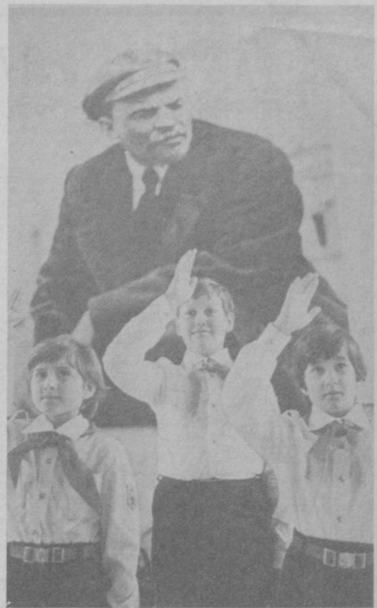
Каждый год в день рождения пионерской организации в Центральном музее В. И. Ленина приходят пионеры столицы, чтобы почтить память вождя революции.

Сегодня — день рождения Всесоюзной пионерской организации имени Владимира Ильича Ленина