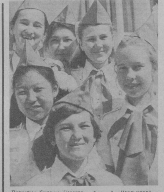
Пионерия Страны Советов.