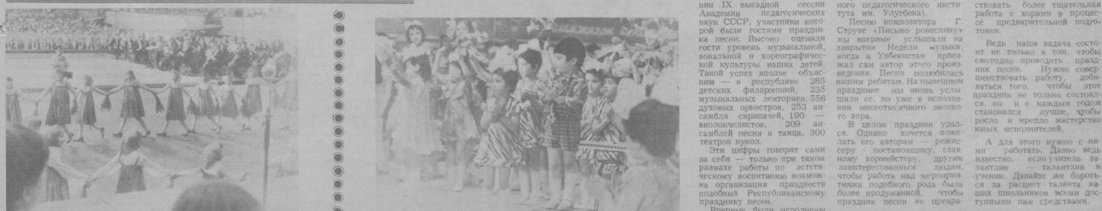
На снимках: моменты Республиканского праздника песни. Материалы 3-й страницы подготовила М. СТРОГАНОВА, наш корр.

В целом праздник удался. Однако хочется пожелать его авторам — режиссеру — постановщику, главному хореографу, другим заинтересованным людям, чтобы работа над мероприятием подобного рода была более продуманной, чтобы праздник песни не превра-