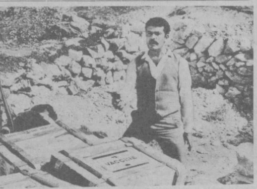
Кадр из фильма «Заложники» производства киносто- дии «Таджинфильм».

преодоление кастовых различий. Только просвещение народа, утверждает фильм, открывает ему путь к светлому будущему. Отвечая на вопросы корреспондента «Учителя Узбекистана», Лакшминат Шарма рассказывает: — Кинематограф Непала молод, его история насчитывает немногим больше двух десятков лет. Среди первых произведений национального кинематографа — работы режиссера Гопал Джи Непали. «Индустриальное развитие Непала» повествует об эконо- номике страны, ее гидро- станции, джугтомов заводе, о построенных с помощью Советского Союза предприятиях. Действие картины «Дамба» происходит на берегах реки, куда приходят строители, чтобы возвести дамбу, которая защитит поля и посевы от разли- вов. У нас в стране очень популярно советское искусство. Мы дорожим творческими контактами с советскими коллегами. Для непальского кино, переживающего период становле- ния, плодотворный обмен опытом, помощь мастеров советского искусства очень полезны. Этому способ- ствовал проходивший у нас фестиваль советского кино. В стране высоко ценят сотрудничество с СССР в области подготовки арти- стов и режиссеров, которые в Непале на практике осу- ществляют все, чему они научились у известных совет- ских мастеров. Первой студенткой из Непала во-