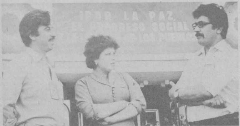
Вот и завершился традиционный Ташкентский кинофестиваль. Он был яркой демонстрацией профессионального мастерства кинематографистов трех континентов, настоящим праздником дружбы и мира. Разставаясь с друзьями, мы не прощаемся с ними, мы говорим им: «До свиданья, до новых встреч на Ташкентском фестивале!»