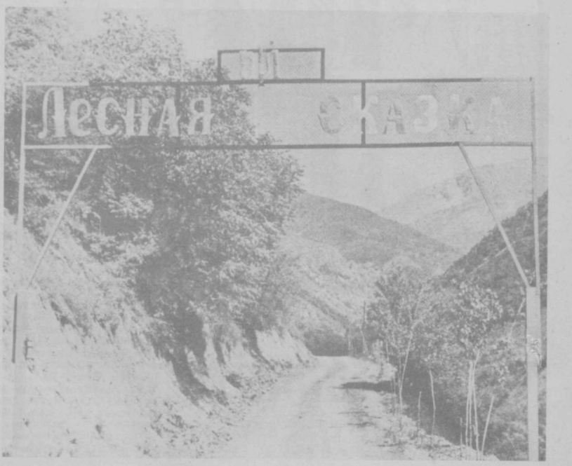
Чистый горный воздух, родниковая вода, прохлада в самый жаркий полдень — все это Бостанлык. Недаром этот район считается основной зоной отдыха труженников Ташкента и столичной области. Одних только пионерских лагерей здесь более 70. Сейчас в них практически завершены подготовительные работы и через несколько дней звонким ребячьим голосам наполнятся корпуса, площадки, летние эстрады. Третий сезон принимает школьников пионерский лагерь «Лесная сказка» Министерства лесного хозяйства УзССР, расположенный на берегу горной речки Наулка, на окраине кишлака Сиджак. К началу пионерского лета здесь заблаговременно силами рабочих Ташкентского завода солицизацонных устройств проведены необходимые работы по ремонту, покраске и отделочным работам. Руководит работами опытный специалист, секретарь парт- организации завода В. А. Пирогов. За лето в пионерском лагере «Лесная сказка» отдохнут более 700 школьников. На снимках: «везд» в пионерский лагерь; специалисты Ташкентского завода солицизацонных устройств В. А. Пирогов и В. С. Павлов заняты благоустройством корпусов; вот в таком живописном месте расположился лагерь.