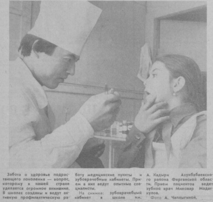
Работа по здоровью подрастающего поколения — вопрос, которому в нашей стране уделяется огромное внимание. В школах созданы и ведут активную профилактическую ра-