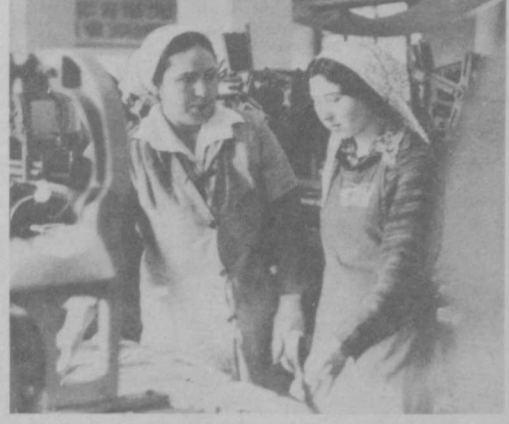
Учащиеся старших классов школ Наманганской области, Наманганской области, записываются в районном УПК, проходят сейчас производственную практику на шелкопрядильном комбинате. Здесь девушки знакомятся с трудом ткачих у опытных мастериц. На снимке: в ткацком цехе.

Эту линию мы проводим и в двусторонних отношениях, ее мы отстаиваем и на международных форумах, в том числе в ООН. Этим мы будем руководствоваться и впредь.