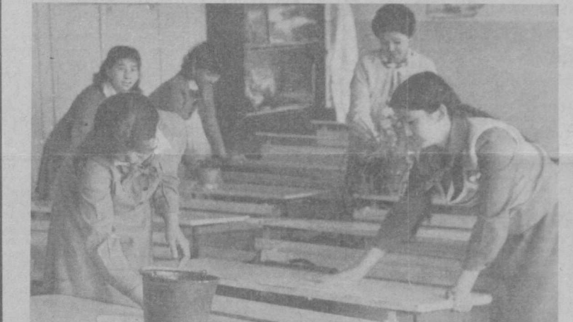
В ремонте школ активное участие принимают сами учащиеся. Из числа старшекласников созданы ремонтно-строительные бригады, за которыми закреплены учителя. На снимке: учащиеся ташкентской школы № 41 готовят классы к новому учебному году.