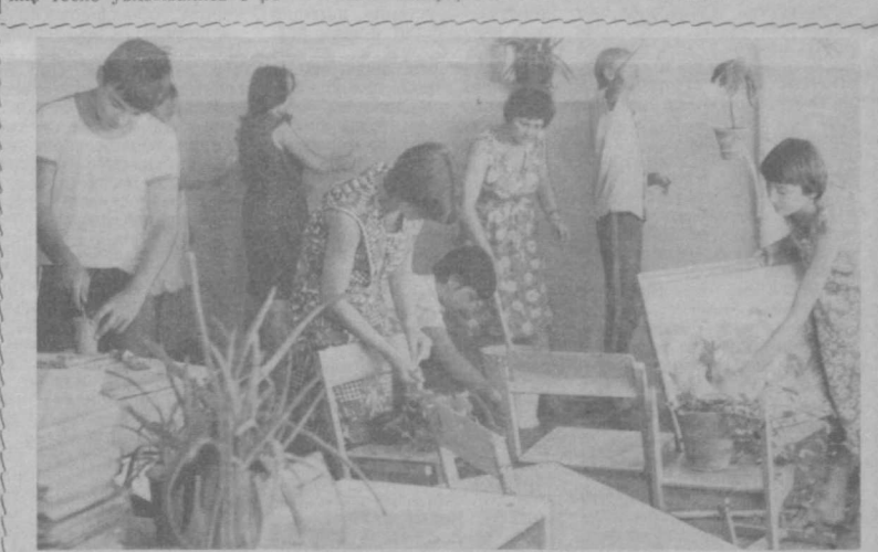
В самаркандской школе № 63 работает 18 строительно-комсомольско-молодежных бригад. Ребята своим силами проводят летний ремонт школы.

Занятия проходили в обстановке открытого обмена мнениями, заинтересованного обсуждения задач, стоящих перед слушателями. Каждый доклад и выступление тесно увязывались с ре-