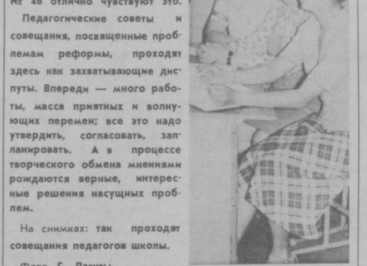
На снимках: так проходят совещания педагогов школы.