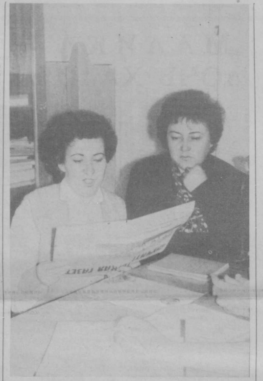
«Держать руку на пульсе времени» — таков девиз педагогического коллектива школы № 46 Сайыр-Рахимовского района Ташкента. А для всех, кто связан со школой, с народным образованием, — «пульс времени» сейчас «бьется» особенно напряженно и радостно. Учителя школы № 46 отлично чувствуют это.

М. БАЗАРОВ, референт Ферганской областной организации общества «Знание».