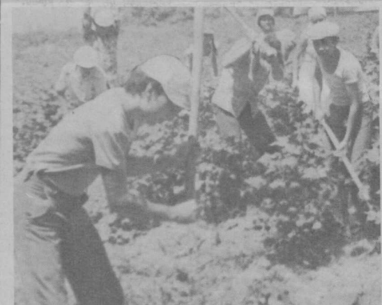
Учащиеся ташкентской школы № 101 — давние помощники сотрудников станции технического обслуживания, что в Янгйулском районе Ташкентской области.

В нем говорится, что критика в адрес подразделений Госкомсельхозтехники УзССР по вопросу обеспечения мягким инвентарем дошкольных учреждений в колхозах и совхозах признана справедливой. Действительно, выделенные фонды не покрывают полной потребности дошкольных учреждений в мягком инвентаре. В 1984 году дополнительно к основному фонду будет поставлено простыней 41,5 тыс. шт., шерстяных одеял на сумму 294 тысяч рублей, наволочек — 4,5 тыс. штук, пододеяльников детских — 5 тыс. штук, полотенца — 5 тыс. штук, матрацы — 1.100 шт., одеял байковых — 6,9 т. м.