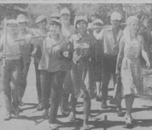
Впереди у школьников много работы. И выполняют она добросовестно, с огоньком. А что может быть лучше и плодотворнее молодого задора!

Одновременно сообщается, что все дошкольные учреждения полностью обеспечены холодильниками, телевизорами, паласами, детским трикотажом и другими хозяйственными товарами.