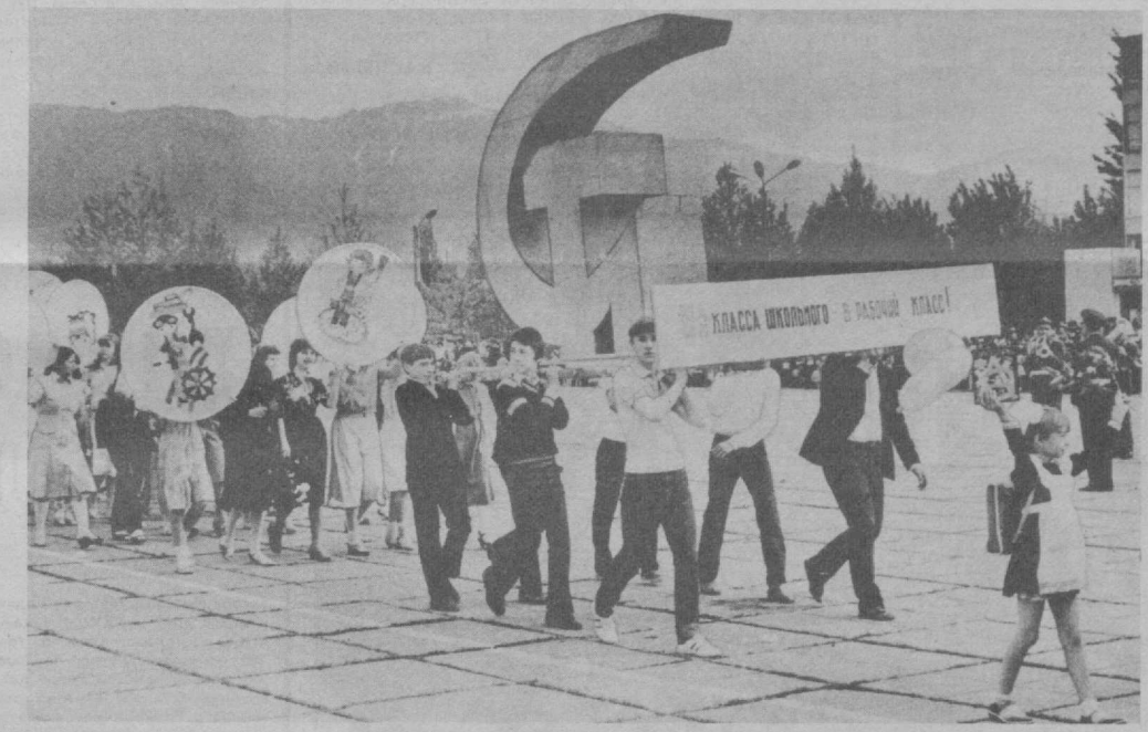
Трудовой праздник прошел недавно среди учащихся школ Газалкента.