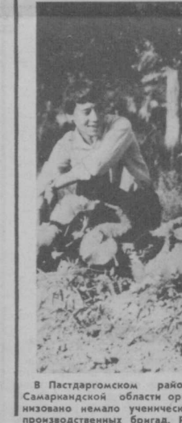
На снимке: во время работы.