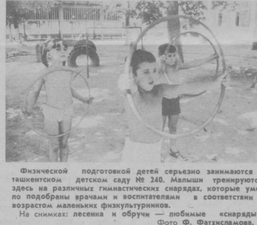
Физической подготовкой детей серьезно занимаются в тахтинском детском саду № 240. Малыши тренируются здесь на различных гимнастических снарядах, которые умело подобраны врачами и воспитателями в соответствии с возрастом маленьких физкультурников.

Бросились родители на базар, да на радостях-то и не подумали, откуда это на прилавках вдруг сено взя-