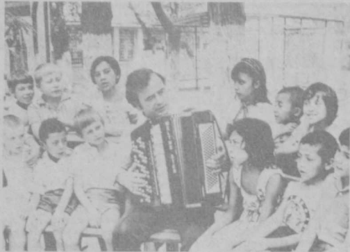
В живописном местечке Ордонкиндзевского района Ташкентской области, в поселке Ялангач расположился пионерский лагерь имени Мичурина.

Нынешним летом за три смены здесь отдохнуло более 1,200 школьников Ташкента и области. Мероприятия, организуемые педагогами лагеря, не только интересны и занимательны, но и полезны для ребят в познавательном отношении.