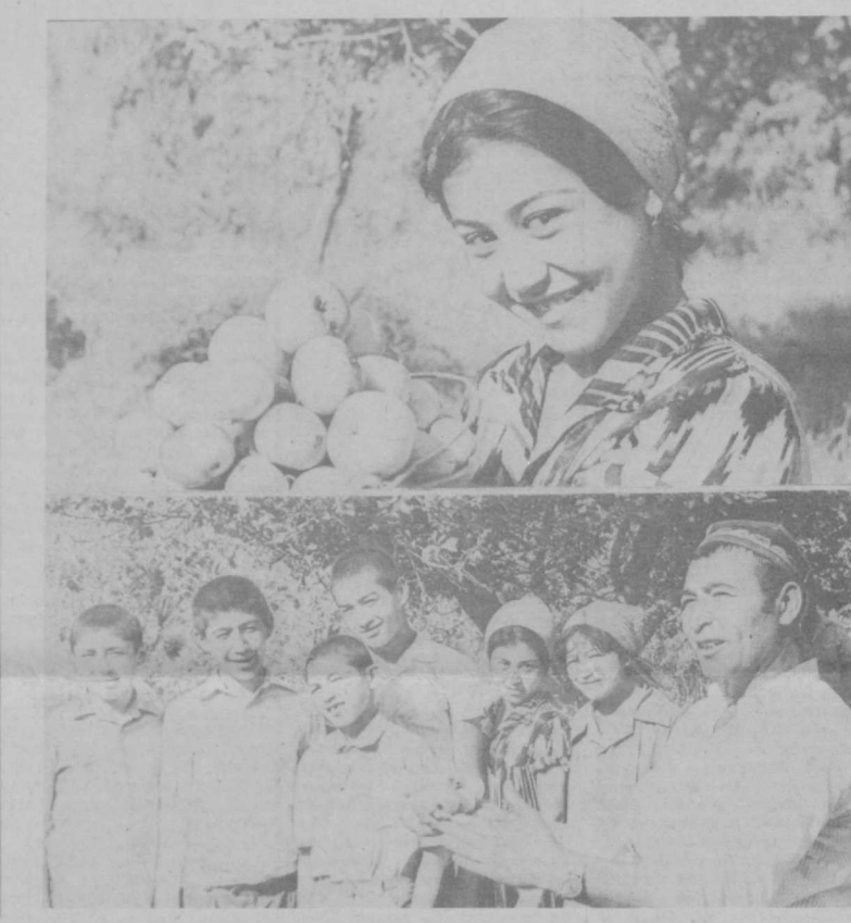
Ученики школы № 6 имени Горького Бекабадского района в течение всего лета активно помогают труженикам сельского хозяйства. Особенно отличились ребята на сборе урожая фруктов, они на славу поработали в саду 4-го участка колхоза «Бекабад» Бекабадского района Ташкентской области. Собранные школьниками яблоки, персики, груши, сливы составляют немалую часть общего урожая участка.

О. ПАНОВА, Д. ЮСУПДЖАНОВА, корр. УзТАГ, Ташкентская область.