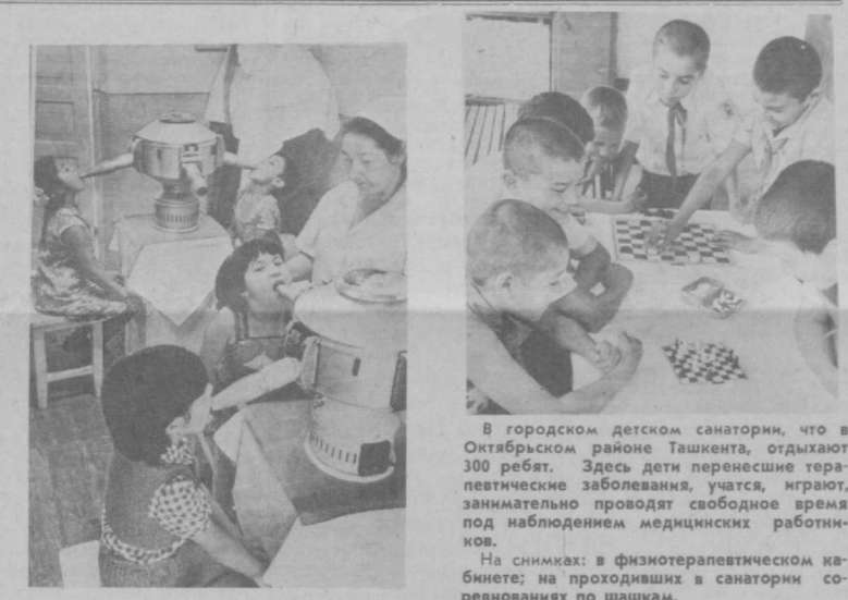
На снимках: в физиотерапевтическом кабинете; на проходных в санатории совхоза на шахтах.

Беседу провел и записал Ф. МУСАЕВ, зав. отделом истории и географии УЗНИИП им. Кары-Низова, кандидат педагогических наук.