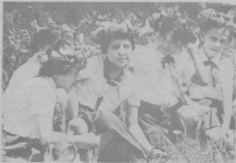
Вот и кончилась пионерское лето...