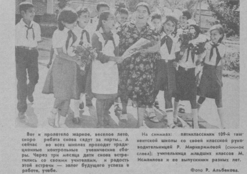
Вот и пролетело жаркое, веселое лето, скоро ребята снова сядут за парты... А сейчас во всех школах прозвучат традиционные контрольные учебные сборы. Через три месяца дети снова встретятся со своими учителями, и радость этой встречи — залог будущего успеха в работе, учебе.