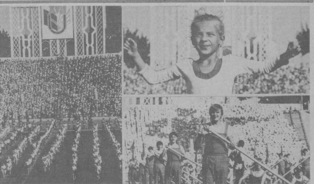
На снимках: торжественное открытие XVII Всесоюзной спартакиады школьников на Центральном стадионе «Пахтакор».