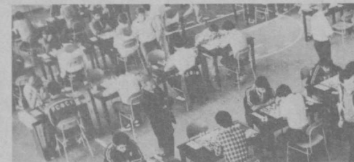
На снимке: в турнирном зале.

В шестерку лучших команд, которые разыгрывают награды спартакиады, вошли коллективы Москвы, Казахстана, Узбекистана, Украины, РСФСР и Таджикистана. Причем, ватерполисты Узбекистана имели на своем счету по два очка, завоеванных в предварительном турнире. Команда Узбекистана получила эти два очка в напряженном поединке с ватерполистами Таджикистана, которые, без преувеличения, стали открытием со-