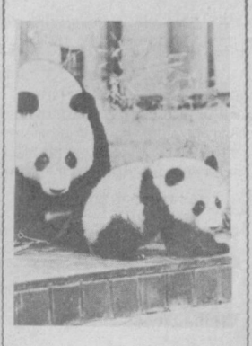
НА СНИМКЕ: Тон-Тон в вольере со своей мамой Хоан-Хоан.

Главной достопримечательностью токийского зоопарка «Уэно» сейчас является малыши-панда по имени Тон-Тон. После своего рождения 1 июня прошлого года он находился под пристальным наблюдением врачей в специальном помещении, ведь рождение панды в неволе — случай редкий и неизученный. Сейчас Тон-Тон чувствует себя отлично и пытается привыкнуть к роли «супер-звезды».