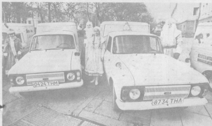
Для вас, горожане