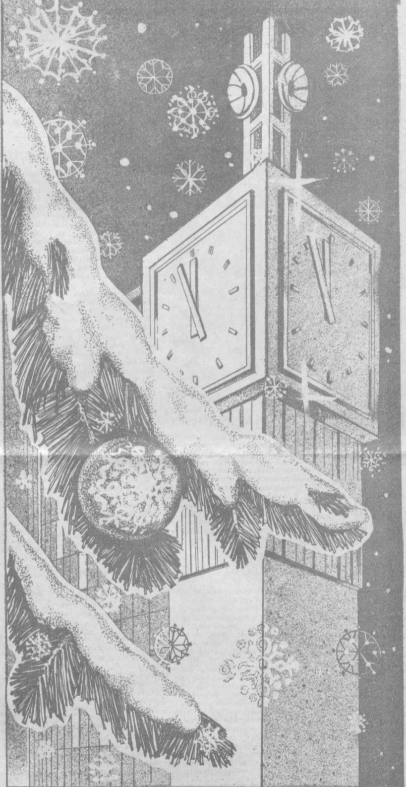
Плакат М. Чумаченко.

передвижные киноустановки, электрооборудование и многое другое. С весны уходящего года после установления прямых шестифазных связей ряда областей Узбекистана с северными провинциями их жителям передано в дар на несколько миллионов рублей предметов домашнего обихода, одежды, тканей, школьных принадлежностей, лекарств. (УзТАГ).