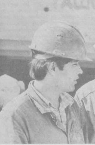
Вступили в строй