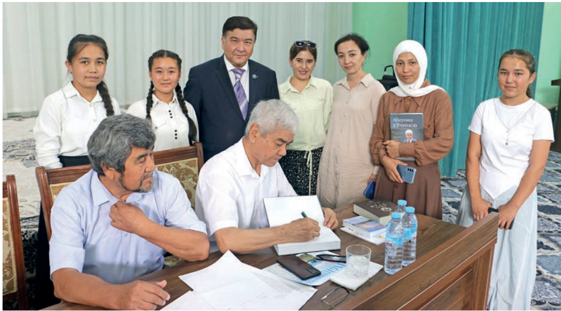
таб ўқувчилари кутиб туришар эди.

“Долзарб 90 кун” лойиҳаси доирасида Бекобод туманида ўтказилган китоб тақдимотига таклиф этишганида хурсанд бўлдик. Чунки дунёда китоб тақдим этишдан улуғроқ, савоблироқ иш борми? Қолаверса, китоб баҳона, китобхонлар билан сўзлашасиз, фикрлашасиз, уларни нималар қизиқтиришни яқиндан билиб оласиз, ижодий режаларингизни шу фикр-мулоҳазаларга таяниб ўзгартирасиз, уларни китоб ўқишга қизиқтириш учун ҳамма куч-қудратингизни ишга соласиз. Дошишманлар бежиз айтишмаган: “Китобни ёқиб юбориш жиноят, бироқ ундан-да оғир жиноят, бу китоб ўқимасликдир”. Ахир ўқувчи бор экан, ёзувчи бор, ўқувчи йўқ экан, демак, ёзувчининг ҳам пайтавасига қурт тушади.