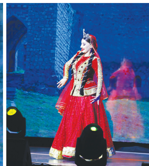
Полосу подготовили корреспонденты «Ishonch» Днера РАВШАНОВА, Кувончбек ТУРАЕВ, Эъвоза УМУРЗОКОВА и Мирнодир МИРАКМАЛОВ